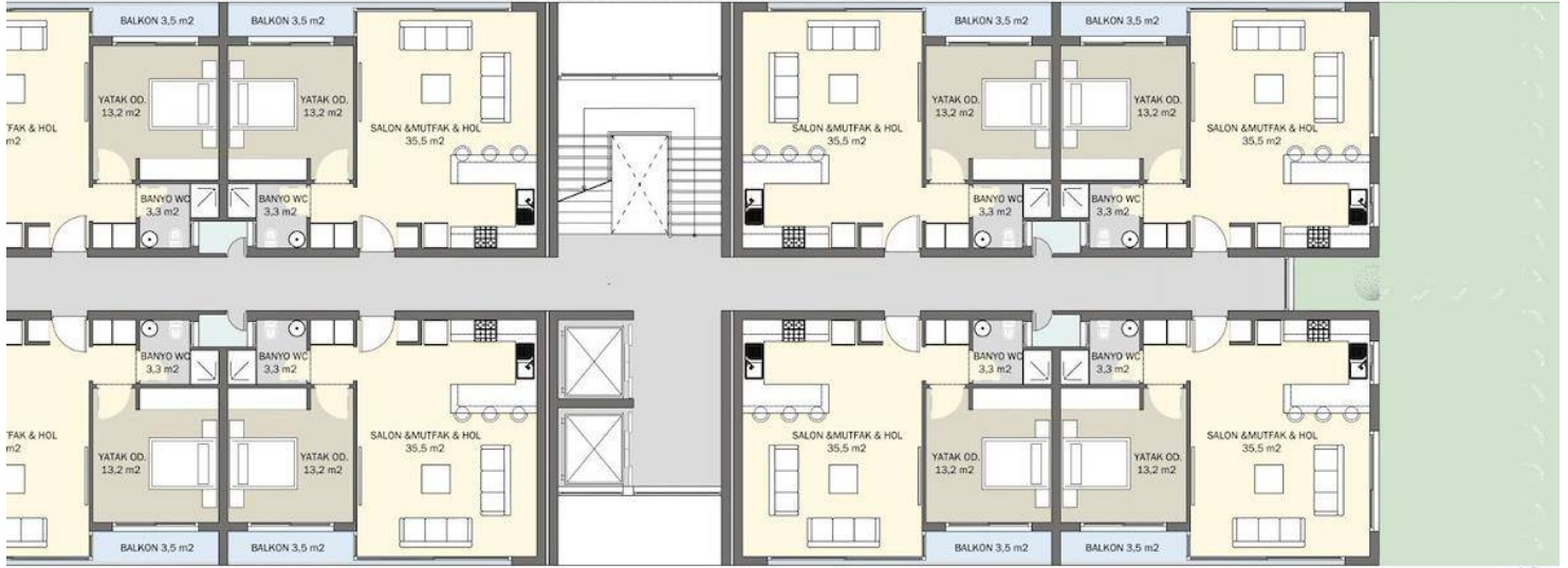
B BLOK TİP KAT PLANI