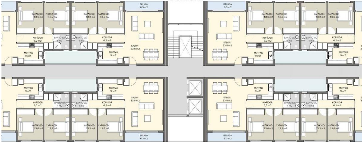
A BLOK TIP KAT PLANI